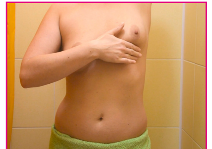
Prowadź samobadanie spiralnym ruchem zbliżając się stopniowo w kierunku brodawki.