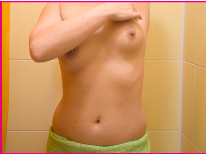
Zaczynając od góry zbadaj dokładnie całą pierś uciskając ją trzema palcami i wykonując w miejscu ucisku okrężne ruchy.