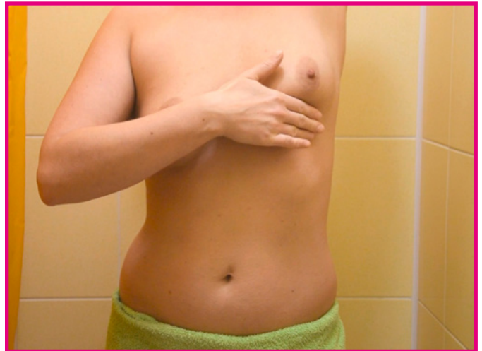
Prowadź samobadanie spiralnym ruchem zbliżając się stopniowo w kierunku brodawki.